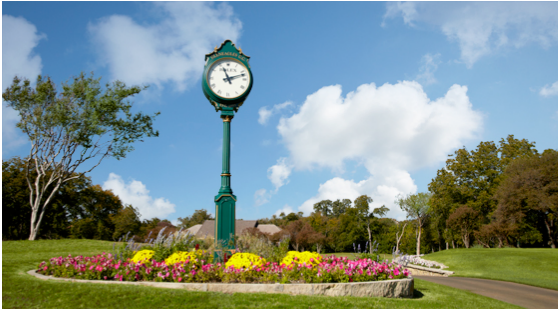
Ornamen Taman – Garden Clock – Jam Taman Kota

Jika Anda melihat taman kota pada umumnya, apa saja yang bisa Anda temukan, umumnya bisa menemukan bunga dan tanaman hias, serta lampu lampu. Memang terlihat indah dipandang, namun akan terlihat kurang hidup dan artistik bila tidak ditambah dengan ornamen lainnya. Dalam hal ini JAM TAMAN KOTA bisa memberikan warna lain untuk keindahan dan manfaat lebih kepada masyarakat yang melintasi taman tersebut.